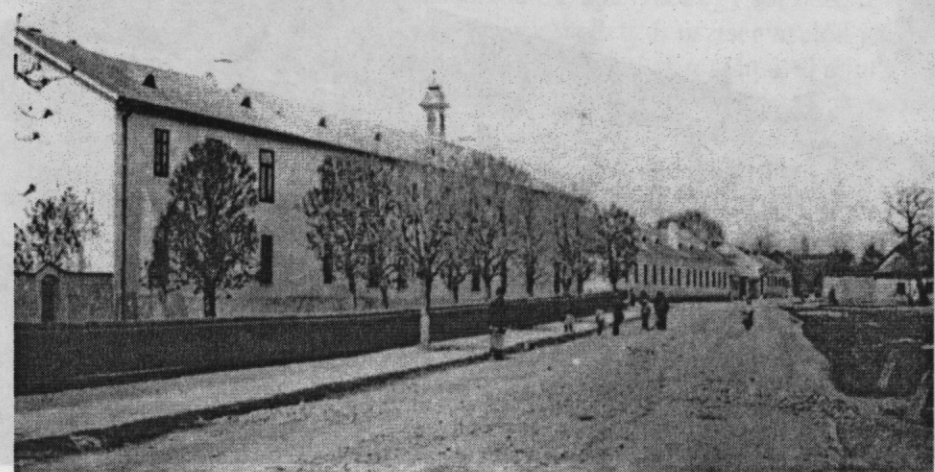
14. kép. A közkórház épülete 1900 körül

A feladatok sokasodása megnövelte a városi adminisztrációt, a hivatalos levelezést, amelyek elvégzésére a jegyző már nem volt elegendő. A XVIII. század elején megjelent aljegyzői tisztség, amely a következő században kettőre emelkedett. Munkájukban városi írnokok segítették őket. A XIX. század elején kialakult a levéltárnoki tisztség, amelyet azonban még gyakran továbbra is a fő-, vagy valamelyik aljegyző töltött be. Bővült a hivataloszolók száma. A hajdúk (2, majd 12) a bíró mellett szolgálókat, közrendészeti feladatokat láttak el. A város foglalkoztatott még tolmácsot, levélhordót, trombitást, órát, éjszakai rendre felvigyázó baktereket, lámpagyújtót, kéményseprőt és kikiáltót. A hivatalok kiszolgálásában felfogadott cselédek is segédkeztek, pl. kocsisok, szőlőpásztorok, csőszök, erdei kerülők, juhászok és vincellérek. A város hivatalainak elhelyezésére, a korábbi alkalmi jellegűek helyett, saját telken egy tágasabb városházat épített (1783–84) a Piac téren a Szent Bertalan-templommal szemben.