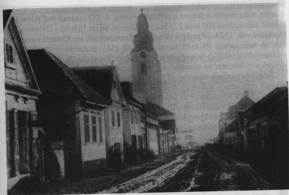
12. kép. A Solymos (Petőfi) utca 1880 körül

A népesség növekedése éppen a szántóföldi gazdálkodásban okozott a legna- gyobb problémát. A gazdák számának megnövekedésével sem a földesurak, sem a város kezén lévő szántók nem voltak elegendők. Vélhetően ez már a XVI–XVII. században is okozott problémát, de a törökök kiűzésével járó népességcsökkenés