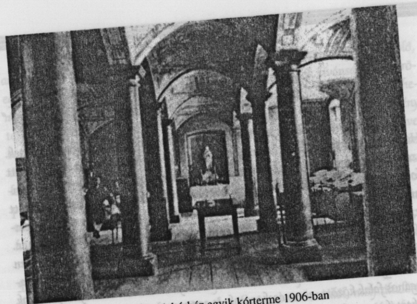
15. kép. A kórház egyik kórterme 1906-ban

A feladatok és tisztségviselők bővülése ellenére Gyöngyösnek mint mezővárosnak a jogai szűkültek. Legdrasztikusabban gazdasági téren. A szőlők 1701-től már házak után lettek összeírva, így egyre inkább a házat birtokló földesurakhoz rögzültek. Ha valaki más földesúr birtok részére költözött, még hosszú ideig átvihetette szőlőjét az újabb földesúri fennhatóság alá. Az úriszék azonban 1816-ban megszüntette a szőlőkkel való szabad rendelkezést, így végleg annak a birtokrészén maradtak, akiknél a határozat kimondásakor találhatók voltak. A XVIII. század elején még a város osztott házhelyeket a földesurak részére is, ezt azonban ők a saját hatalmuk alá vonták. Egyre több belterületet is megszereztek, 1735-ben pl. a Solymos (Petőfi) utcai szérűskerteket és a Belső-Mérges-patak közötti „elmaradott szántóföldeket”. A hg. Esterházy Miklósnak jutott részen jött létre a későbbi Miklósváros. 1740-re a kocsmáltatási jog is teljesen a földesurak kezébe került, akik a város kárára jobbágyaiknak is engedélyezték az italkimérést.