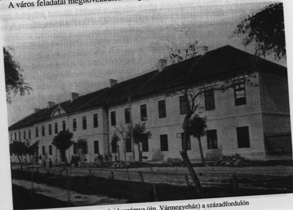
13. kép. A lovassági kaszárnya (ún. Vármegyeház) a századfordulón

A város feladatai megnövekedtek az egészségügy területén is. Orvosokat és szü-